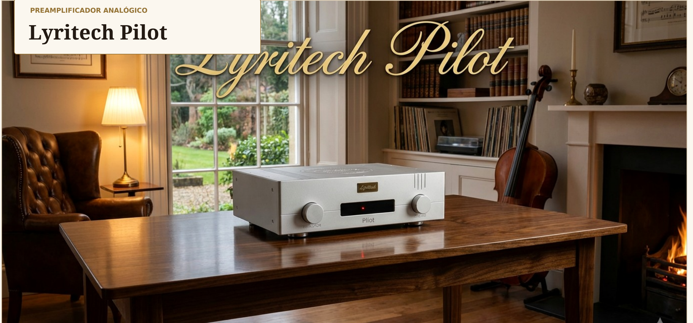
Fotografía de ambiente. Texto separado para no cubrir la imagen.