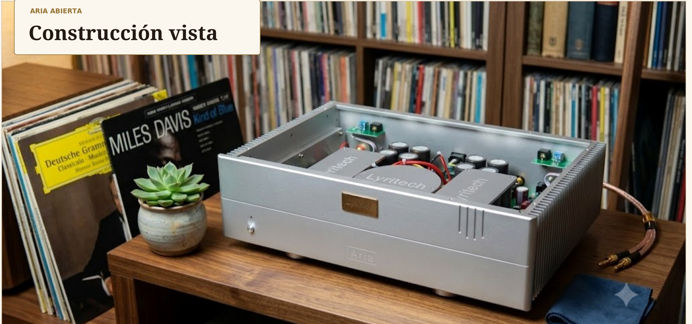
Imagen interior y de ambiente de la etapa Lyritech Aria.