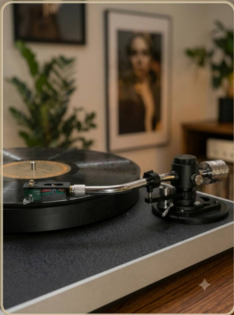
EIZZ EZ-6009E | Schubert D960