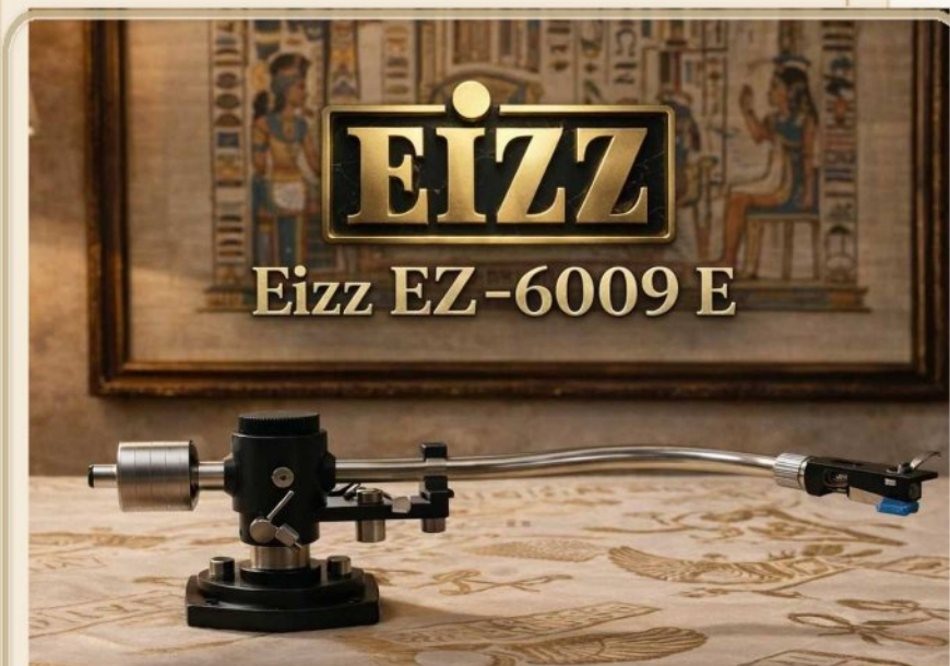
EIZZ EZ-6009E | Schubert D960